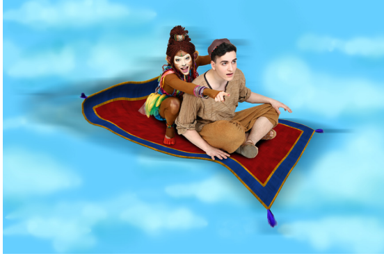
Aladin und Susu auf Teppich

Download unter http://www.maerchensommer.at/stmk/presse.html