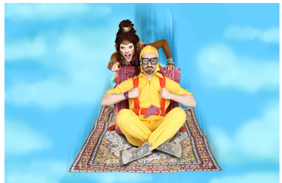
Susu und Teppich