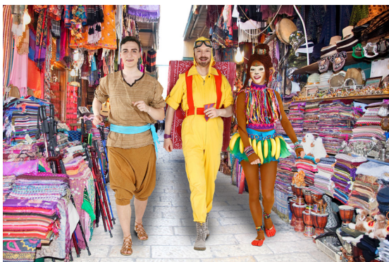
Aladin, Susu und Teppich im Bazar