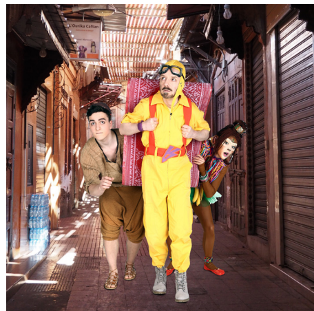
Aladin, Susu und Teppich im Bazar