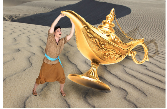
Aladin mit Lampe - © Martin Hesz