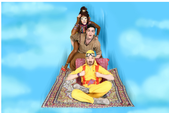
Aladin, Susu und Teppich