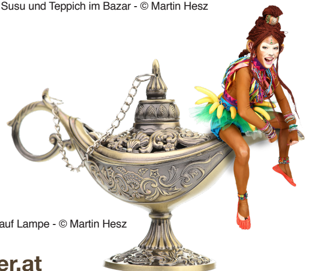
Susu auf Lampe